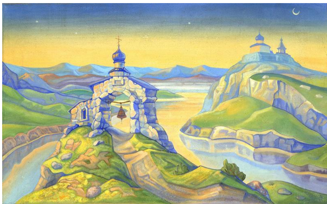
Н.К.Рерих. Пейзаж с часовней.